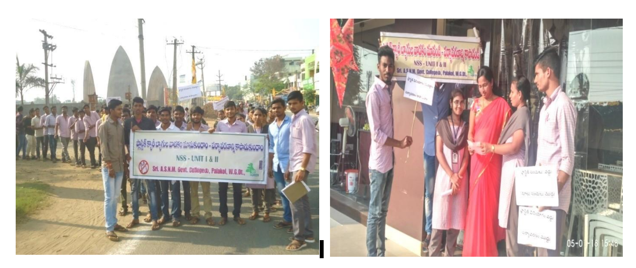
Rally & Distribution of Pamphlets exposes Hazards of Using Plastic Bags