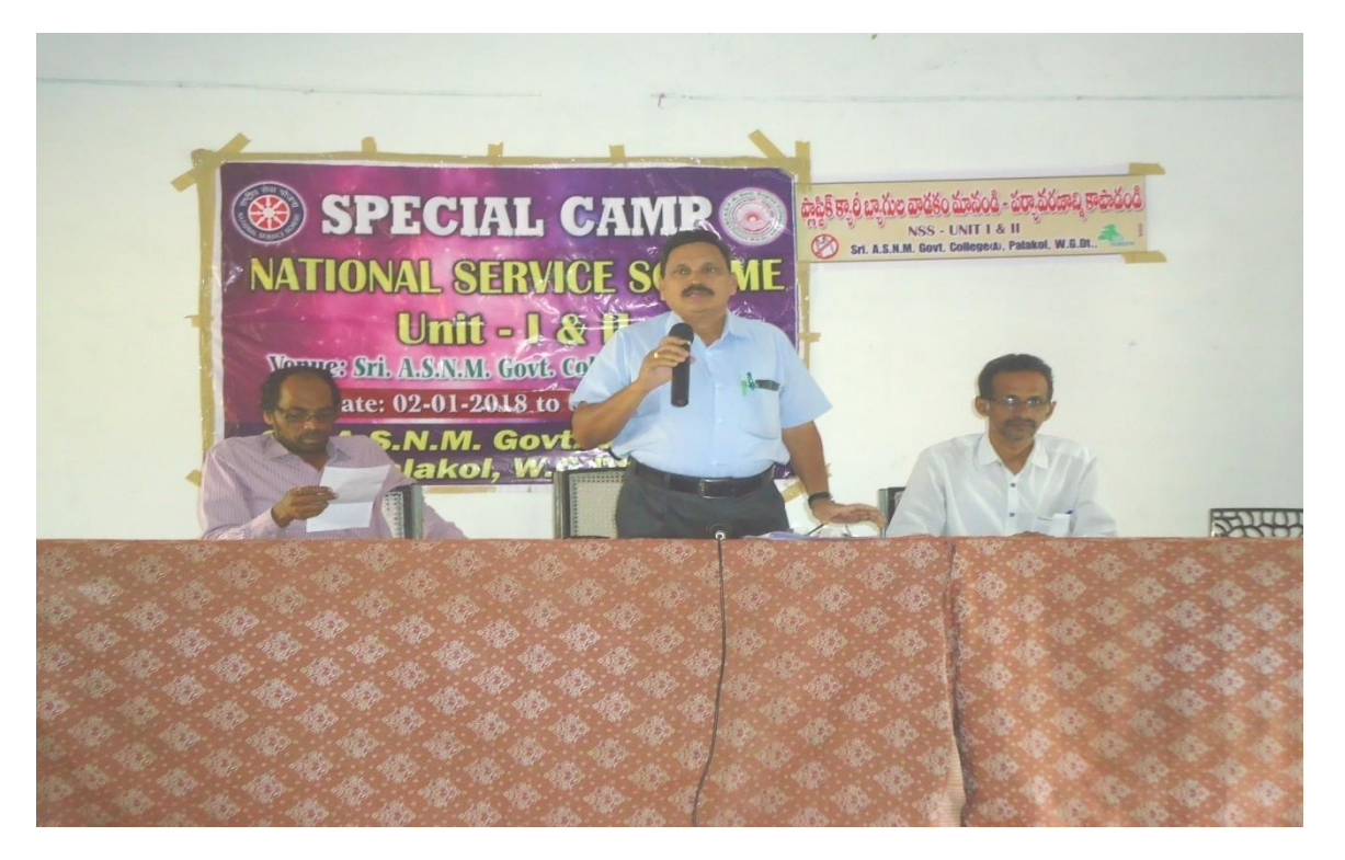
Principal Addressing the NSS Volunteers