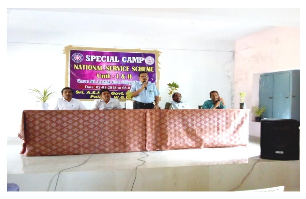
Addressed to NSS Volunteers by Principal