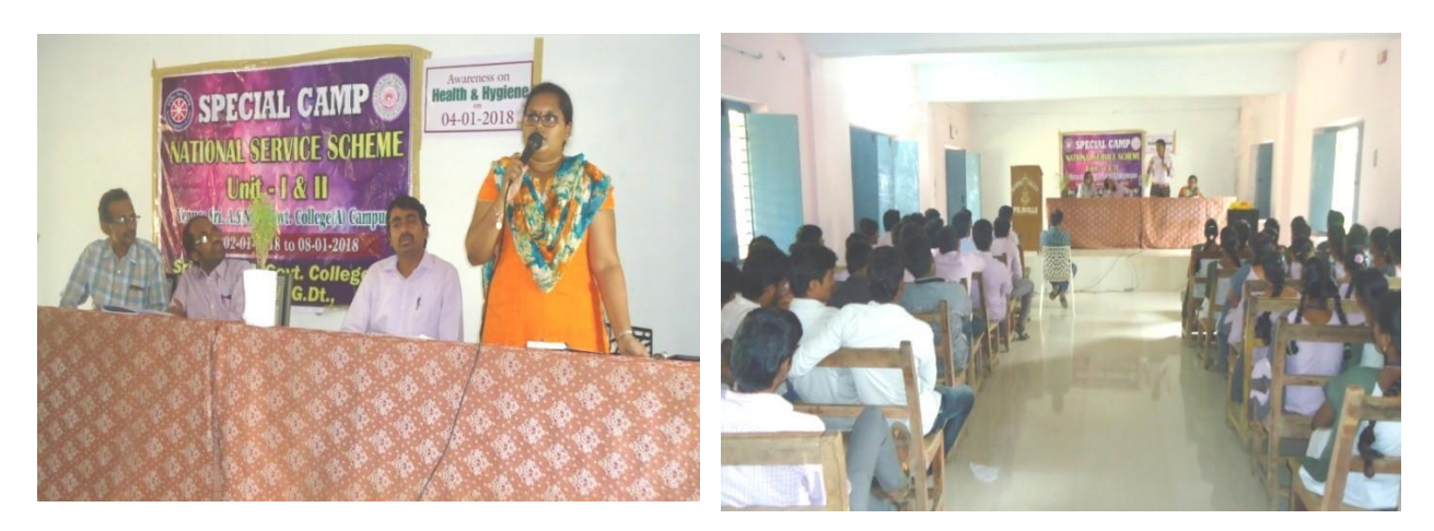
Awareness developed among the Volunteers by Resource Persons