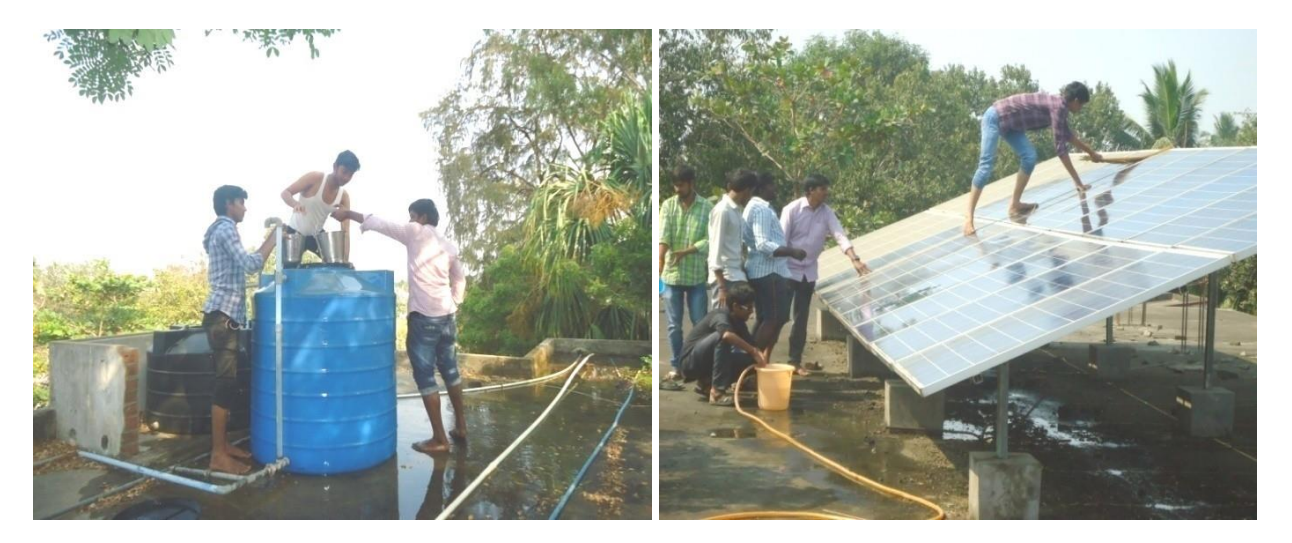
Cleaning of Water Tank & Solar Panels by NSS Volunteers