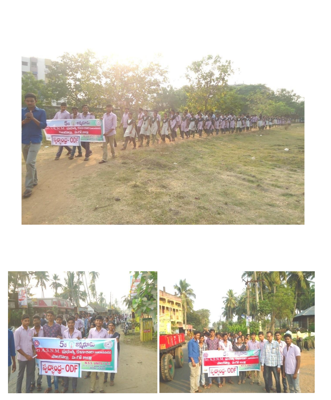
O.D.F Rally in Adopted Village Under Janmabhoomi Programme by Volunteers